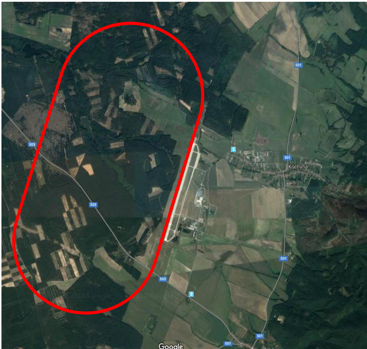
Obrázok č. 2 Okruch Letiska Kuchyňa

Cenová ponuka: ..... bez DPH ..... s DPH